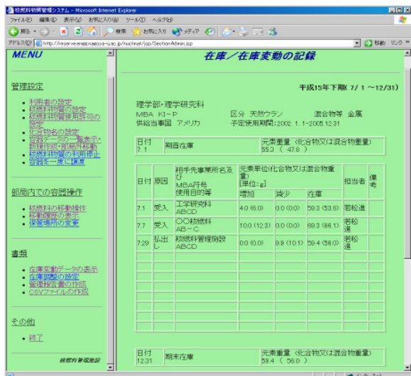
図 3. 在庫変動記録の閲覧