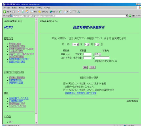
図2. 核燃料物質の移動