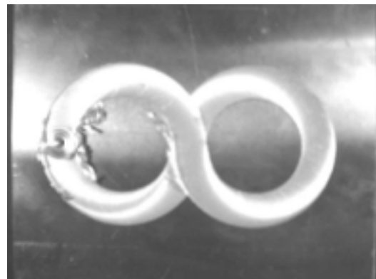
図 4 加工例 (円弧補間による 8 字制御)

図 4 に 180 度の円弧補間を 4 ステップ組み合わせ 8 字運転を行った例を示す。極めてスムーズな外観を得て所期の仕様を満足できるものである。また制御に関しても原点復帰や繰り返し精度について仕様の 0.05mm を満足し、所期の制御仕様をクリアできた。