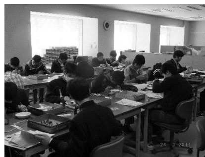
図 2. 電子回路工作