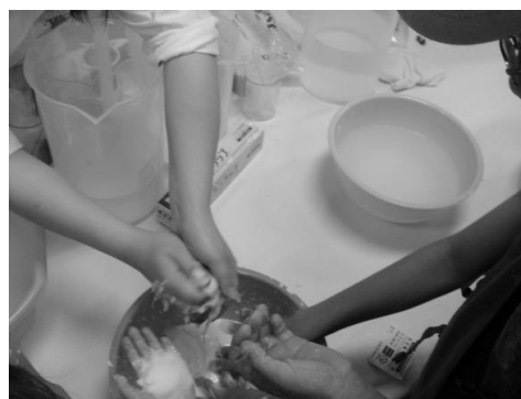
図2. ダイラタント流体を体感