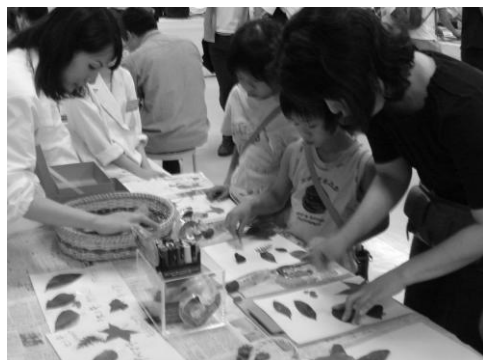
図3. 葉っぱや木の実を使って絵を描く

参加者の様子：絵を描く事により、それぞれの植物の名前、形態、特徴などを教えた。素晴らしい感性の作品もあった。また、参加者にとっては植物に対する興味が増えたようであり、喜んでもらったと思う。