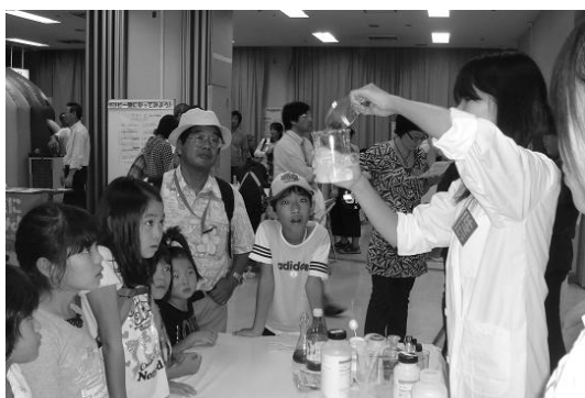
図1. 重曹とクエン酸に水を加え発泡する実験

参加者の様子：急いでかき回したり、奥まで手を入れようとするとダイラタンシー現象を実感できた。その後、原理の説明をすると実験を面白く感じたようだった