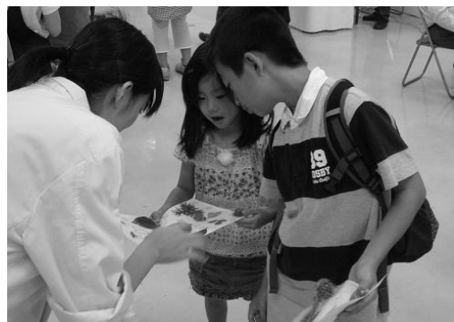
図4. 葉っぱの名前や特徴の説明

謝辞 本活動を支持し、理解下さる全学技術センター及び教職員の皆さまに深く感謝申し上げますと共に、一緒に頑張ってくれたあかりんご隊の皆さまに心よりお礼をお申し上げます。