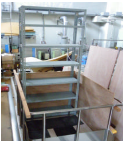
図 1 実験台に固定したスチール棚