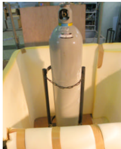
図 2 実験台に固定したボンベとボンベ台