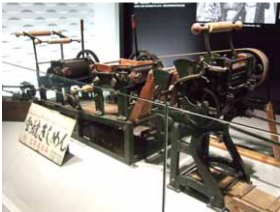
写真3 初期の麵製造機