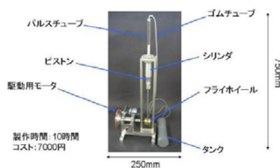
図1 従来型冷凍機外観（2007 製作）

従来型冷凍機 1), 2) の外観を図1に示す。作動実験において室温から6分で-32℃に達するという優れた冷凍効果が得られ、冷却部において霜の発生が確認できた。(図2) また、この冷凍機は、実際に仕事から熱へのエネルギー変換のデモンストレーション用教育教材として (1) 授業「熱力学」の中で熱サイクルの応用例として紹介、(2) 学生実験の中で紹介(図3)、あるいは(3) 市民向けものづくり講座の学生実習の紹介などに幅広く活用された。