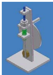
図 4 改良型冷凍機 3D 図

新しく製作した冷凍機を図 5 に示す。上部には取手がつけられ、持ち運びに適した形になっている。冷凍サイクル実現に必要なクランク軸回転数は 700rpm であり、コイルスプリングを内蔵した遠心力式回転計で所望の回転数を得る構造になっている。本装置を手動で 2 分間作動させたところ、室温から -3^{\circ}\text{C} まで温度を下げる事ができた。冷却部には従来機同様、霜の発生が確認できた。(図 6)