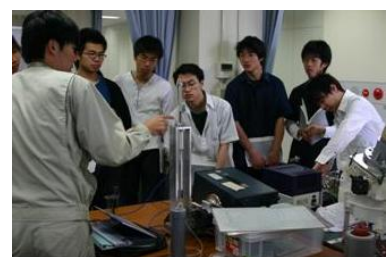
図3 「学生実験」におけるデモの様子