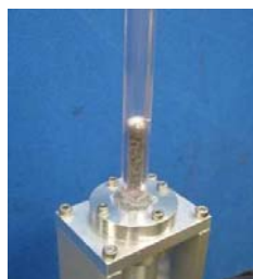
図2 作動実験の様子