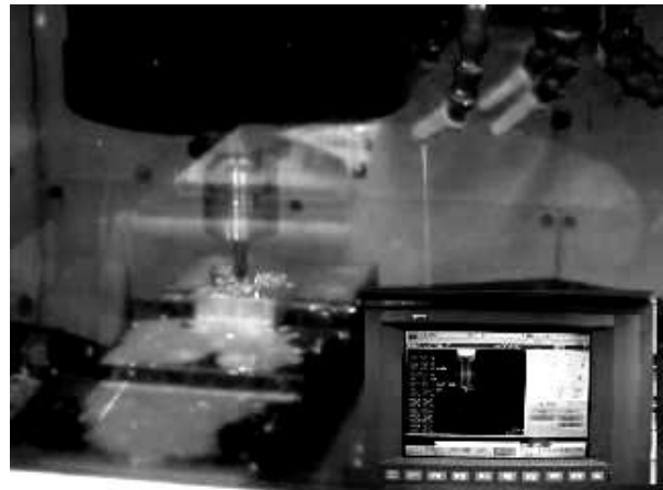
図 2. マシニングセンタの加工状態を示す動画

実習を行う前の予備知識として図 2 のようにマシニングセンタの加工を動画で示している. 初めて体験するマシニングセンタの予備知識は, 実際に行う実技と併合して実習の内容を理解するのに有効的である. このような動画をホームページ上で軽快に閲覧するために, mpg, avi 形式から FLASH ファイル swf 形式に変換する必要がある. 約 1/4 の容量で再生表示が可能である.