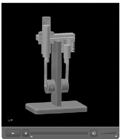
図 3. スターリンエンジンのアニメーション