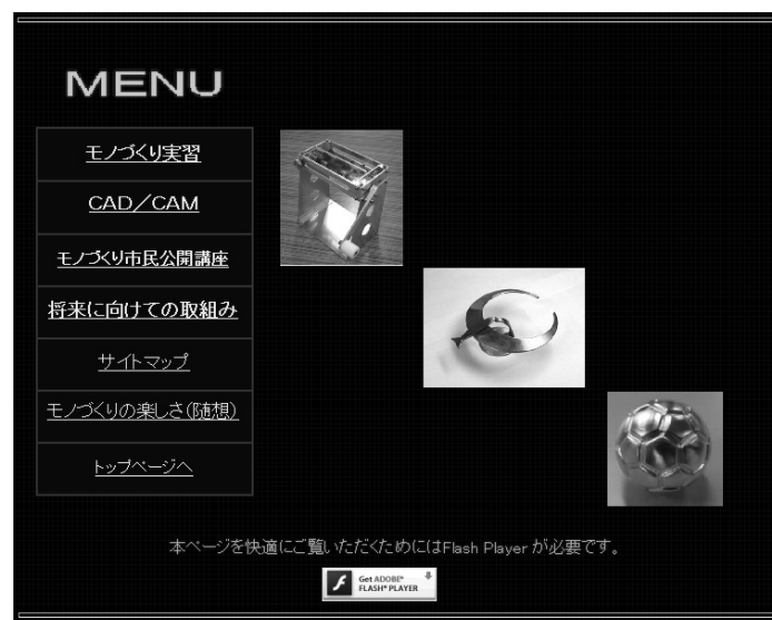
図5. メニューページ

メニューページ（図5）はモノづくり実習・CAD/CAM関連・モノづくり市民公開講座（一般市民を対象）・将来に向けての取組み・サイトマップ・モノづくりの楽しさ（随想）・トップページから構成されている。